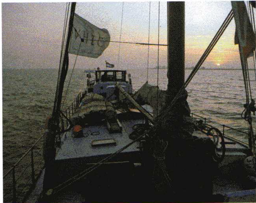
Sfeerfoto van de Quo Vadis op het Markermeer met gestreken zeil

Met een wereldwijde stijgende vraag naar energie, de daarbij behorende prijsstijging en de milieuproblematiek neemt de behoefte aan alternatieve en schonere energie toe. De redactie van Aandrijftechniek ging voor een dag aan boord van het klassieke schip Quo Vadis van de VHZC (Verenigde Hollandse Zeil Compagnie). Onderweg van Amsterdam naar Enkhuizen liet ze zich informeren over het project Fair Energy.