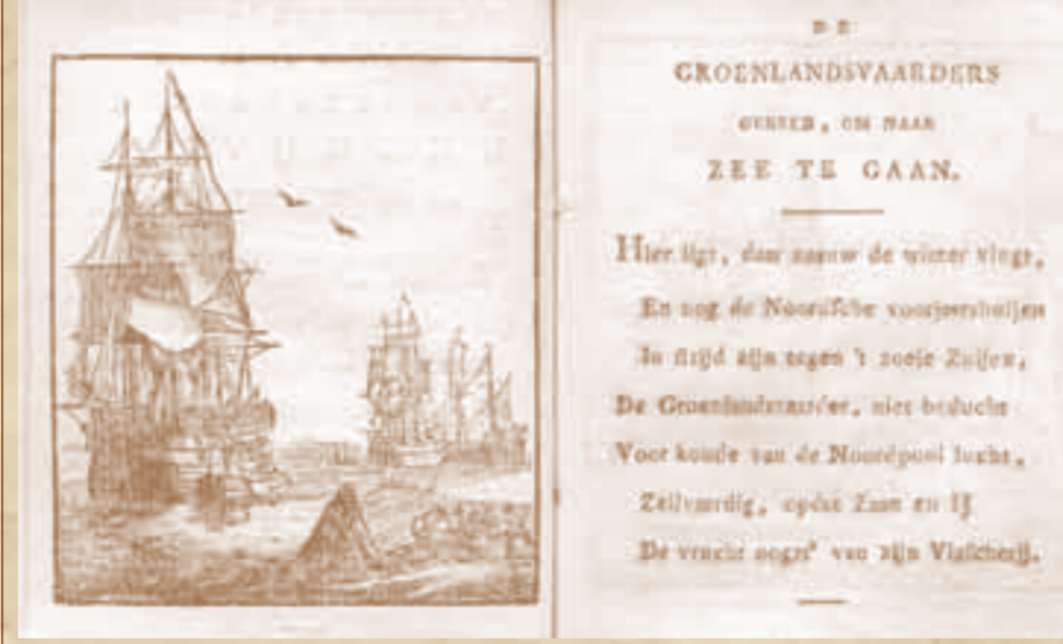
Prentverbeeldingen: De Groenlandsvaarders rond 1760, deel 1 Enkhuizer Almanak, jaargang 1818