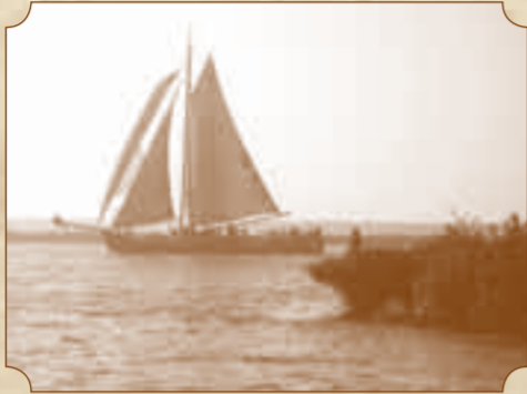
Klippersace 2008, Enkhuizen