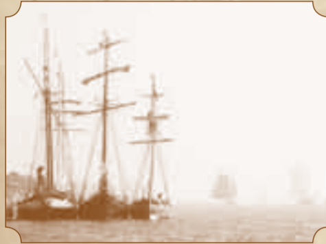
Krabbersgat, Enkhuizen