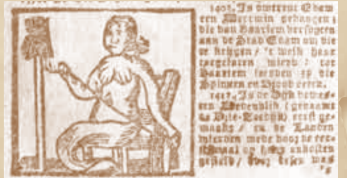
Kroniek over 1403, Enkhuizer Almanak jaargang 1784

Ook de bewoners van Haarlem – een machtige stad – hoorden van het wonder vertellen en ze zonden burgers uit, om haar in levenden lijve te aanschouwen. Ze keerden terug en zeiden: 'Het is een mooie zeemeermin, die men ons in Edam getoond heeft.' 'Wanneer het een mooie zeemeermin is,' mompelde een burger, 'dan komt ze Haarlem méér toe dan Edam.' Toen keerden zij, die haar gezien hadden, naar het kleine stadje aan de Zuiderzee terug, en ze vroegen, of Haarlem de zeemeermin bezitten mocht. De Edammers waren hierover zeer bedroefd. Zij gingen tot de burgers der trotsche stad en vroegen: 'Wilt ge haar hebben?' 'Ja.'